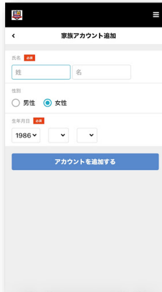
【4.追加情報を入れ登録完了】